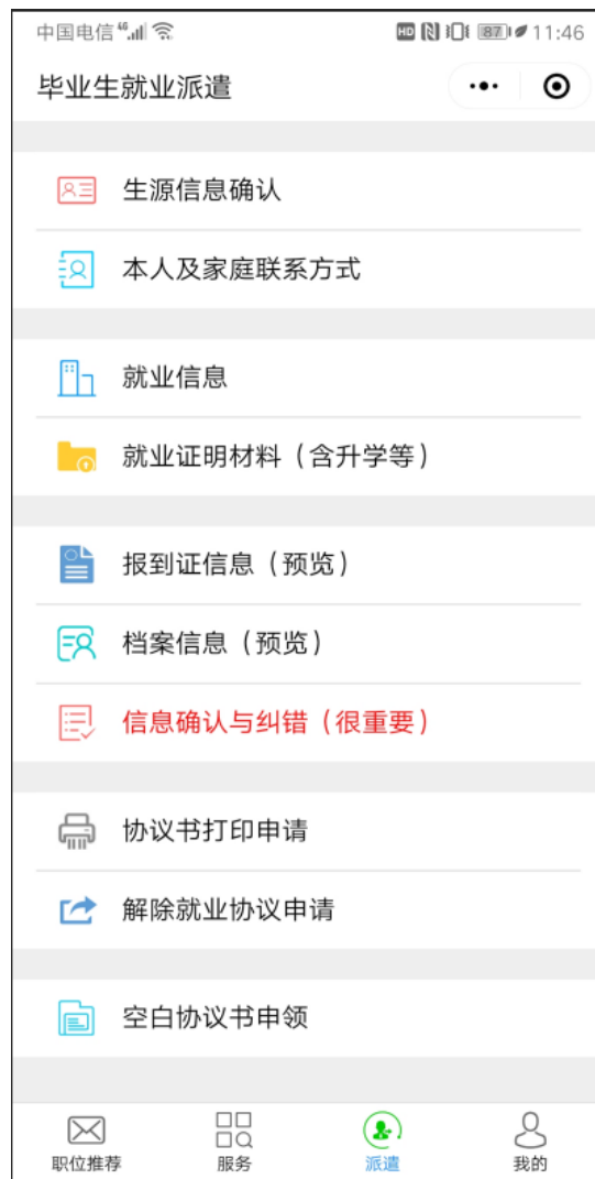
图 1-2 学生界面

选择院校，输入毕业生本人的姓名、学号和身份证号，点击“登录”进入平台用户主页如图 1-2 所示。