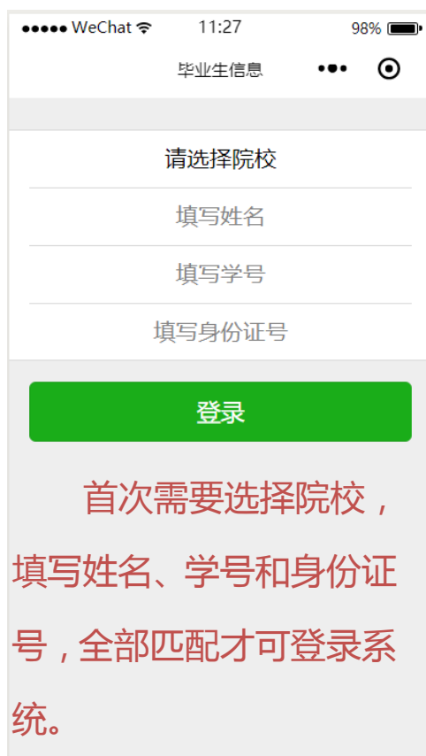
图 1-1 平台登录界面