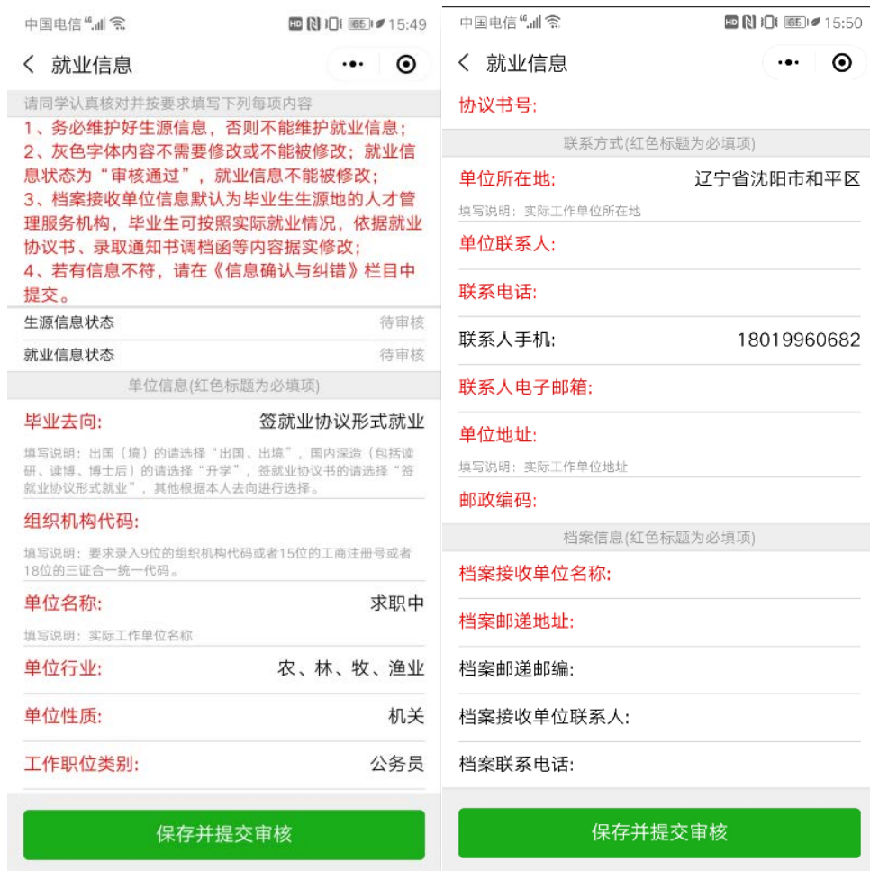
图 2-3 就业信息维护