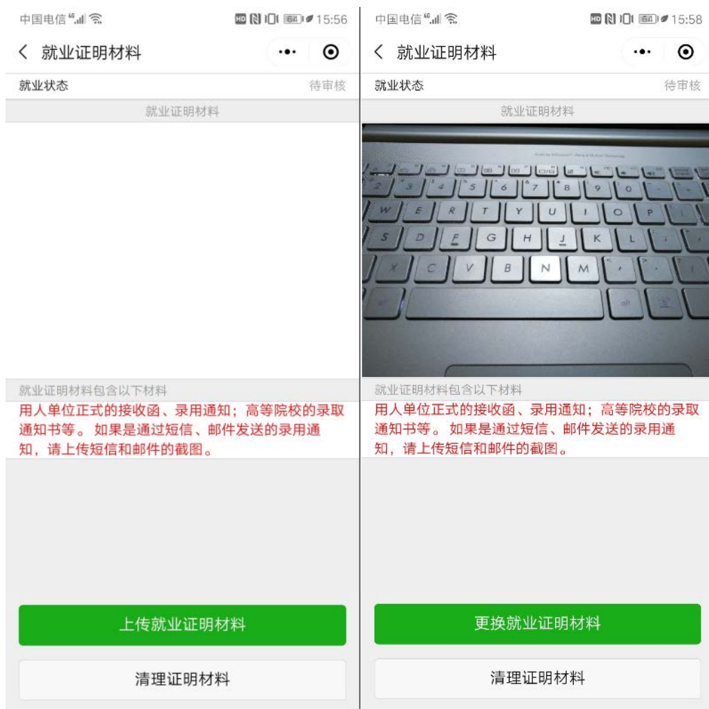
图 2-5 就业证明材料的上传与清理

对于已经落实工作的，包含升学和出国出境，须上传其就业证明材料，一旦被审核后，将不能修改。