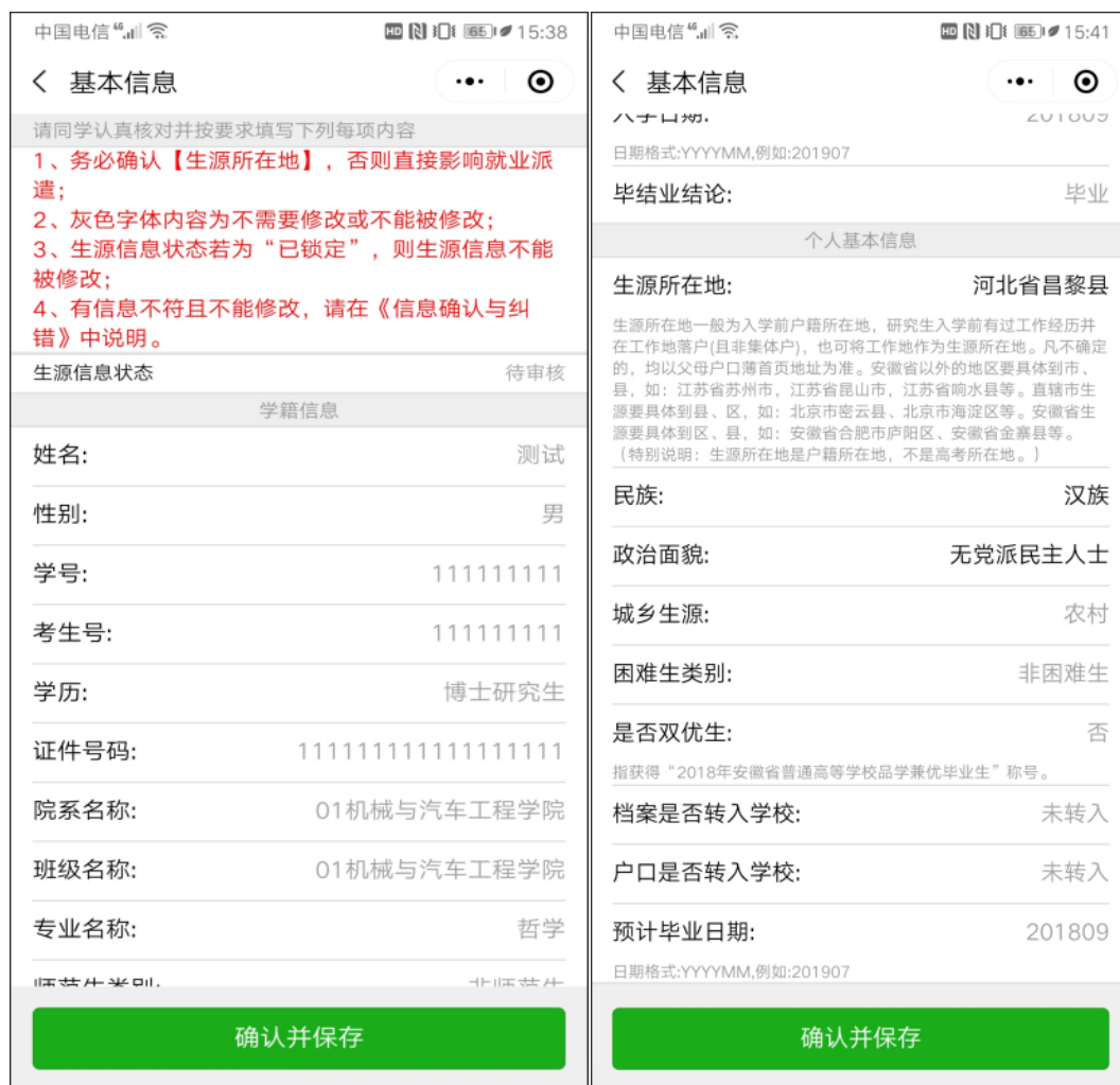
图 2-1 基本信息维护

毕业生基本信息包括学籍信息和个人基本信息，其中学籍信息包括姓名、性别、学号、考生号、学历、专业名称、师范生类别、培养方式等，毕业生没有修改权限，但可以核对，若是发现有误报辅导员处修改；个人基本信息包括院系名称、班级名称、生源所在地、证件号码、民族、政治面貌、城乡生源、是否双优生、困难生类别、户口是否转入学校等，其中 生源地 和 城乡生源 是需要毕业生自己维护的，请按照真实的生源信息维护。